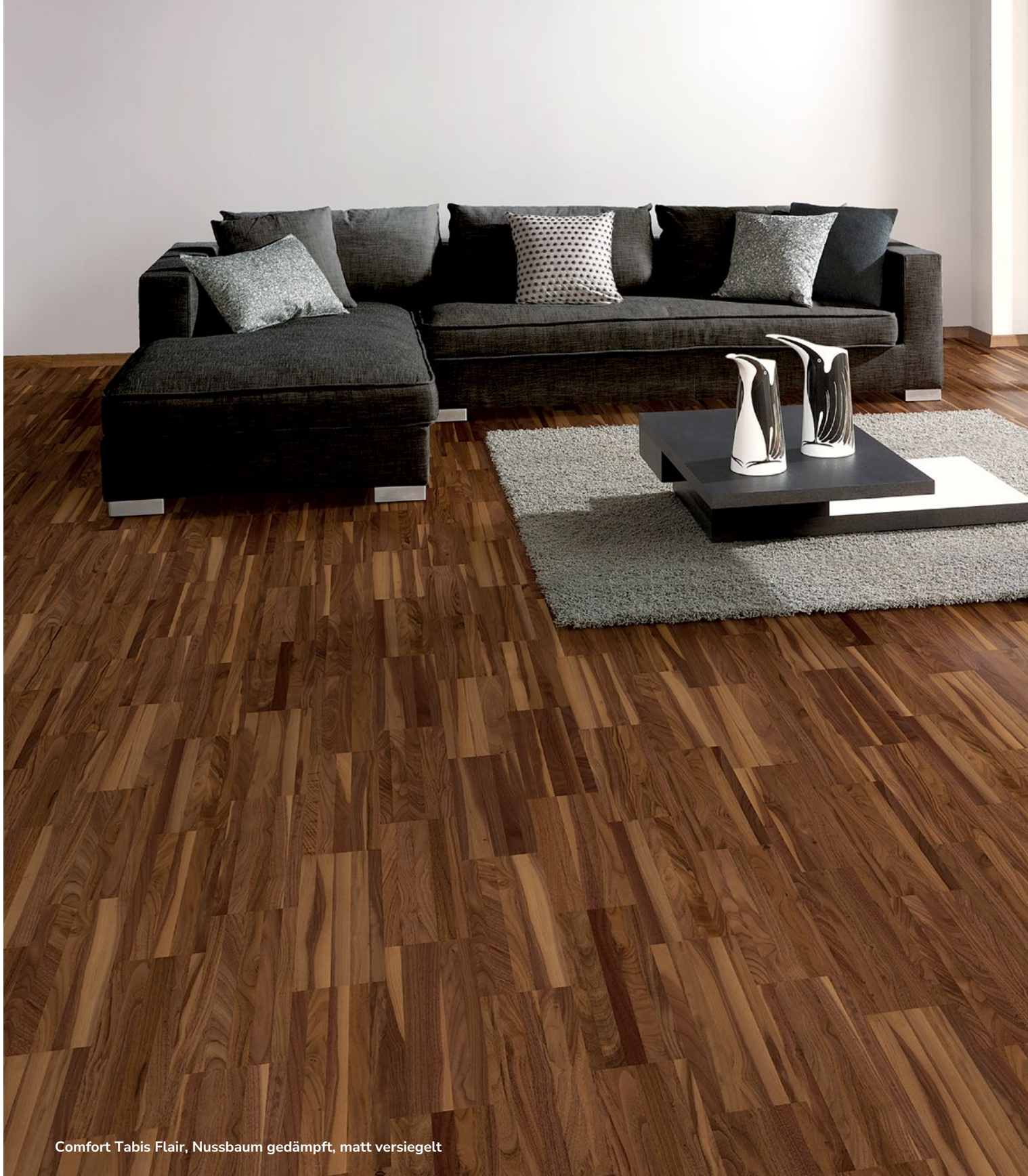
Comfort Tabis Flair, Nussbaum gedämpft, matt versiegelt